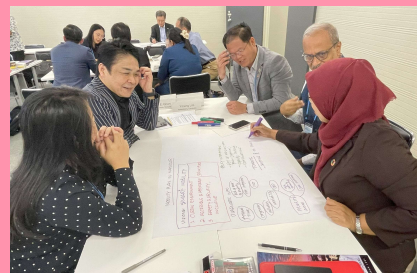
途上国の行政官と日本企業のワークショップ