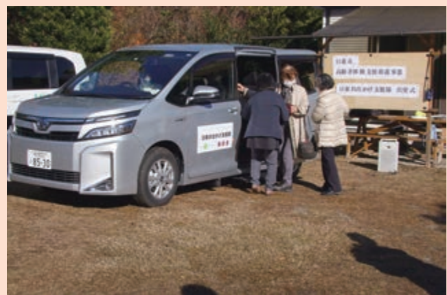
高齢者の移動支援のモデル事業