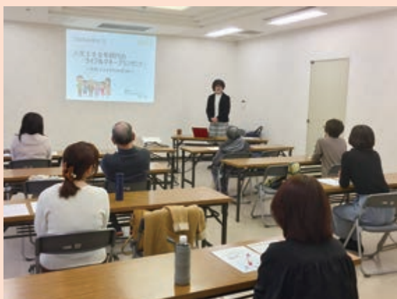
高齢者の就労・生きがいづくりの一体的支援のモデル事業