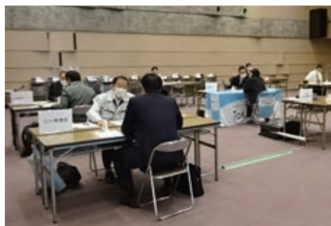
【地域別就職面接会】