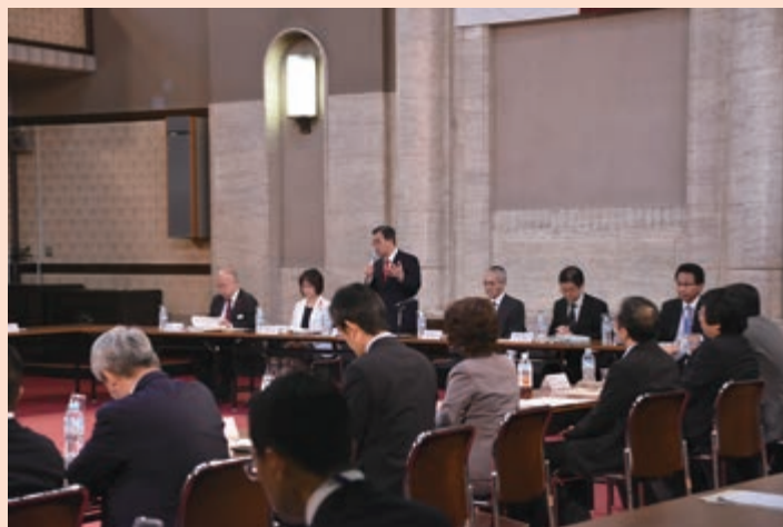
「あいち就職氷河期世代活躍支援プラットフォーム」会議

具体的には、就職氷河期世代のうち、「不安定な就労状態にある方」へは、安定就職に向けた取組により、正規雇用者を17,700人増やすことを目標としています。また、「長期にわたり無業の状態にある方」については、地域若者サポートステーションを活用して当事者や家族の希望に応じ、求職活動へ踏み出す支援や就労その他の職業的自立支援につなげることを目標としています。さらに、「社会参加に向けた支援を必要とする方」については、一人一人の状況に合わせた、就労に限らない多様な社会参加に向けた支援体制の充実をめざしています。