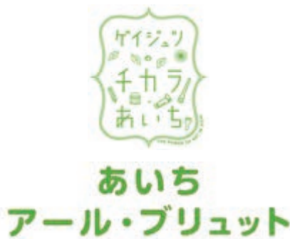
【あいちアール・ブリュットのロゴマーク】