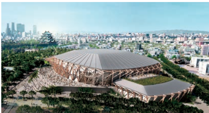
【愛知県新体育館イメージ図】