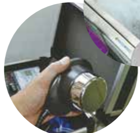
ちょうおんぱ 超音波