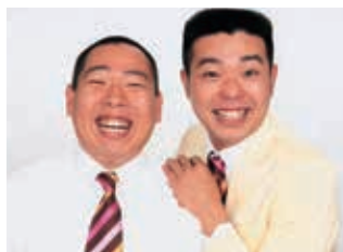
よしもとクリエイティブ・エージェンシー

2014年にコンビで介護職 員初任者研修の資格を取得! 数多くの介護・福祉に関する イベントで講演やあるあるネ タを披露。