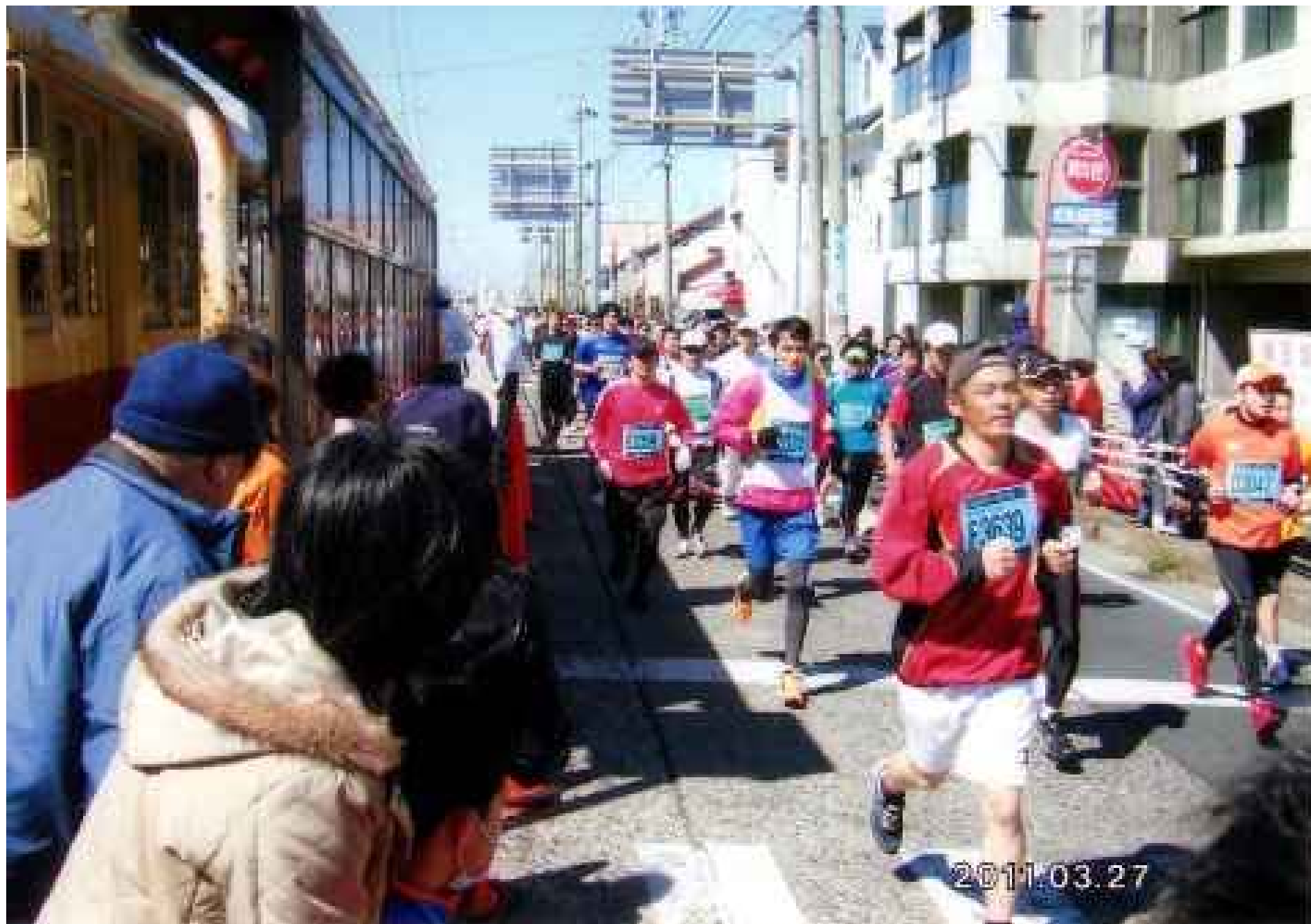
市電を愛する会の「ハーフマラソン応援号」と併走するランナーたち。会員も車窓や沿道から応援。