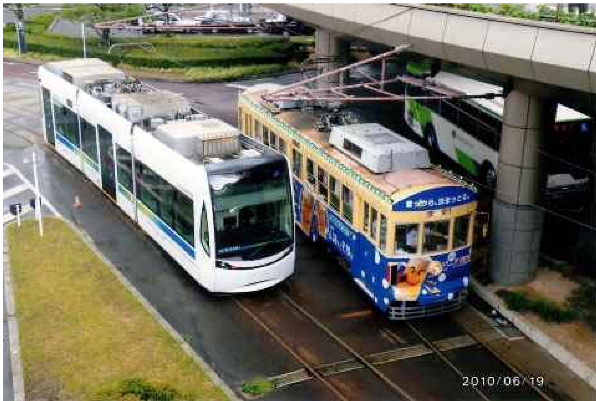
夏の「ビール電車」とほつラム