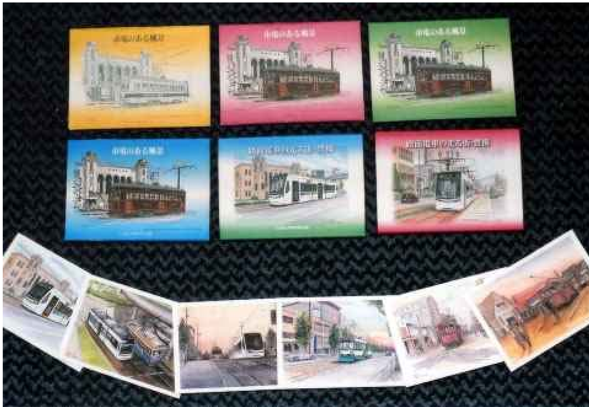
1993年レトロ電車がエバーグリーン賞を受賞したことを記念して、絵はがきセット「市電のある風景」を発売。 定価/¥500