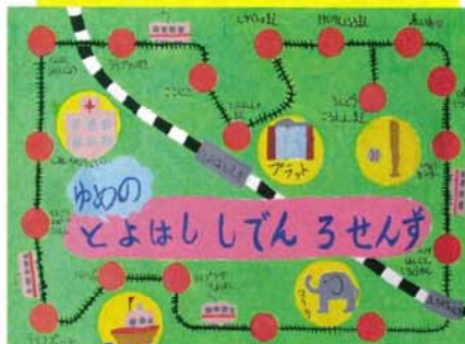
鷹丘小学校2年 みらいのせんろ コンドウ ホノカ 近藤 穂香 とよはしのいろいろなところへ、しでんでいけたらいいなあ。