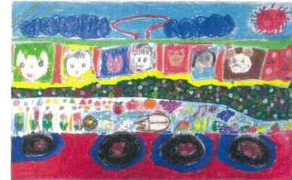
吉田方小学校1年 みんなの仲よし市電