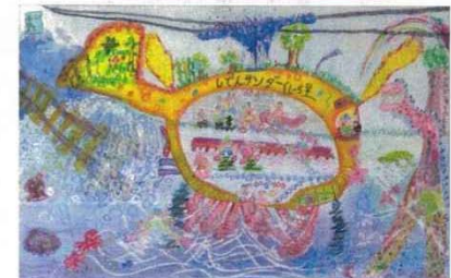
東田小学校2年 水陸両用ゆめ電車