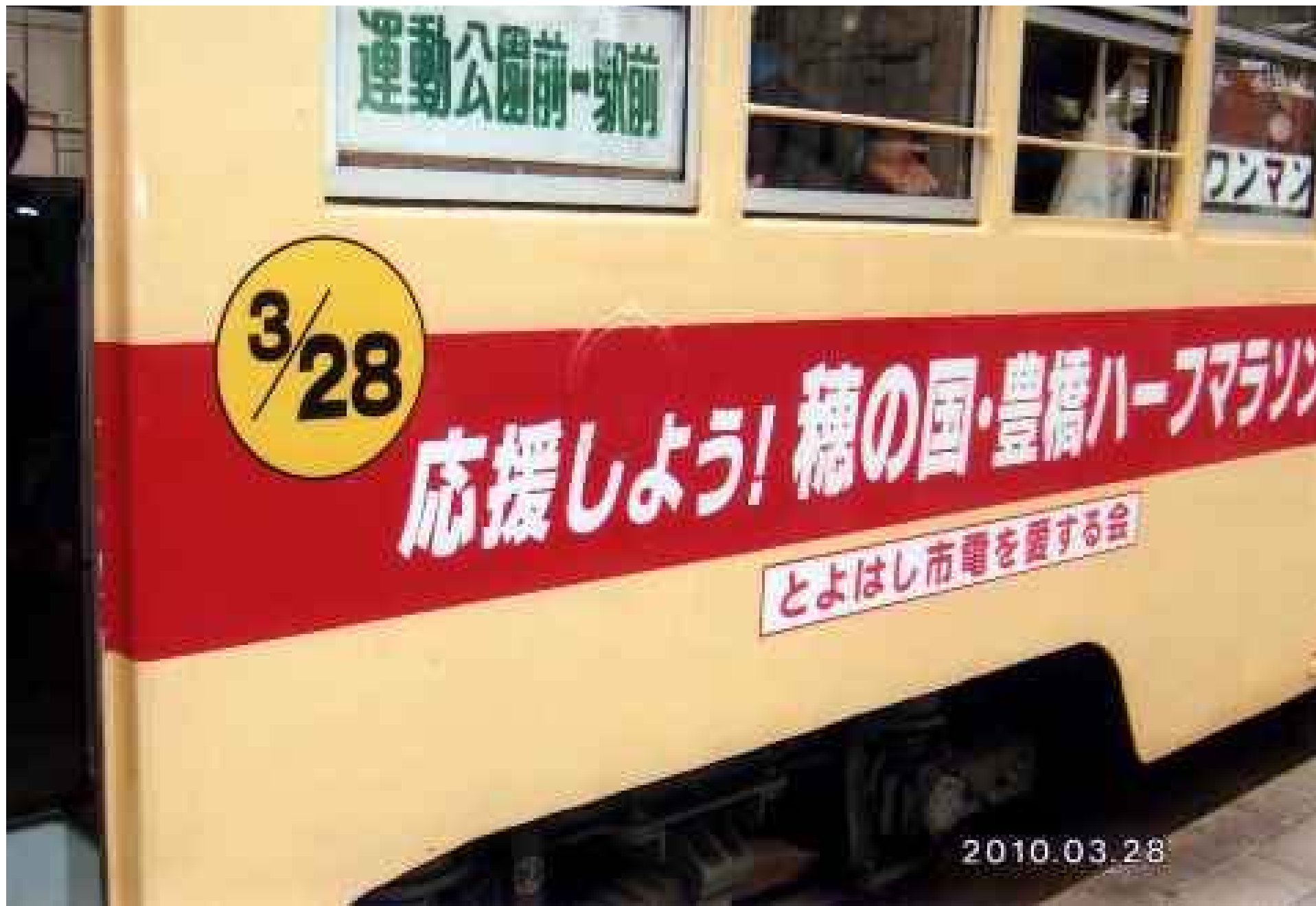
ハーフマラソン応援号