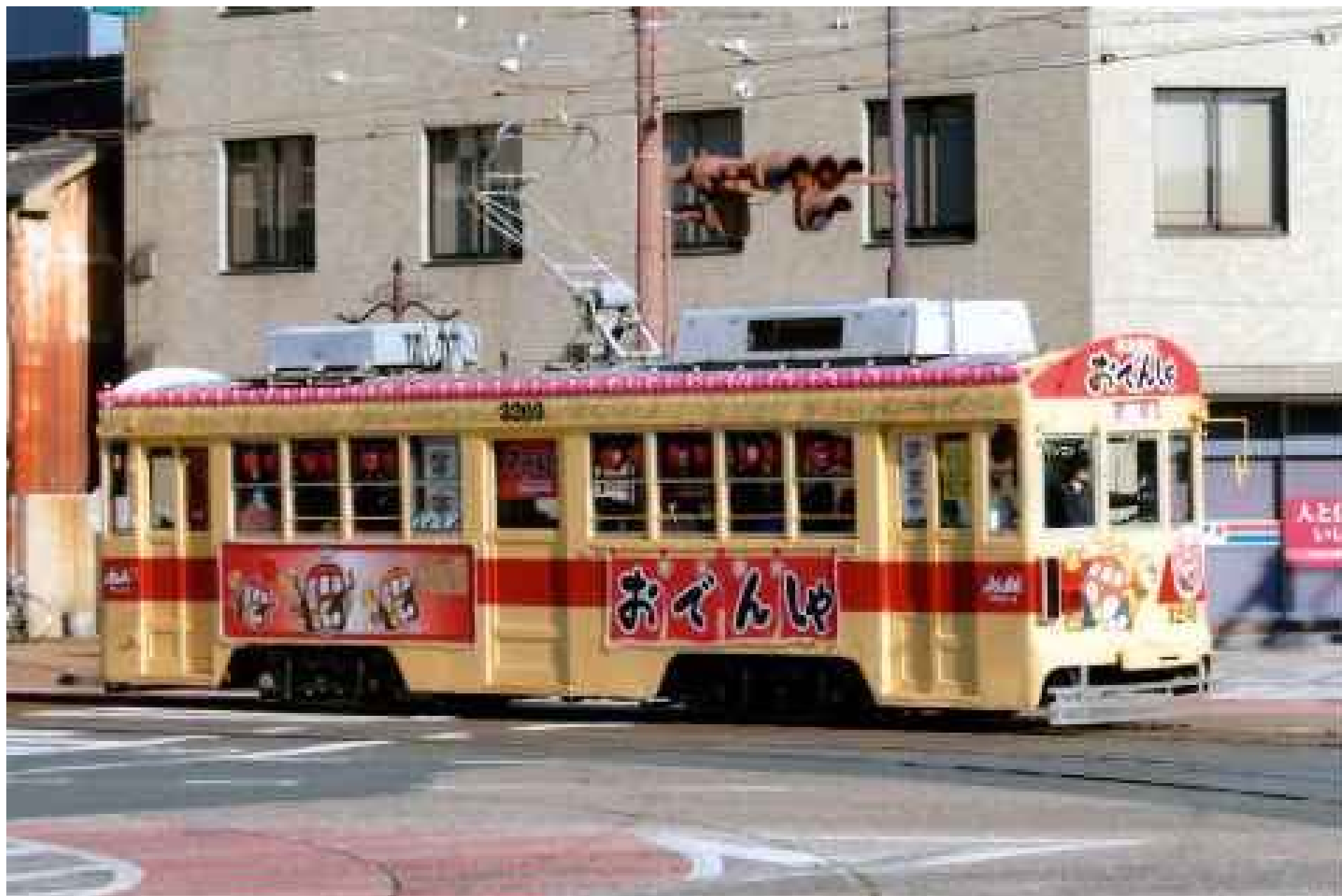
冬の「おでんしゃ」。デザインは市電を愛する会伊奈会長。