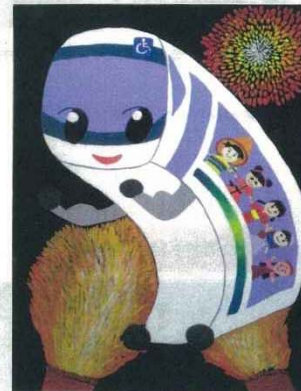
磯辺小学校6年 世界交流夢電車