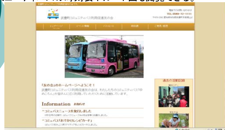
武豊町コミュニティバス利用促進友の会

これまでの友の会の活動を整理し、情報発信のツールとして作成。コミュニティバスの時刻表やルート図も閲覧できる。