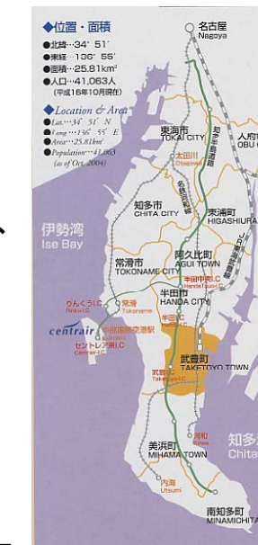
武豊町コミュニティバス利用促進友の会