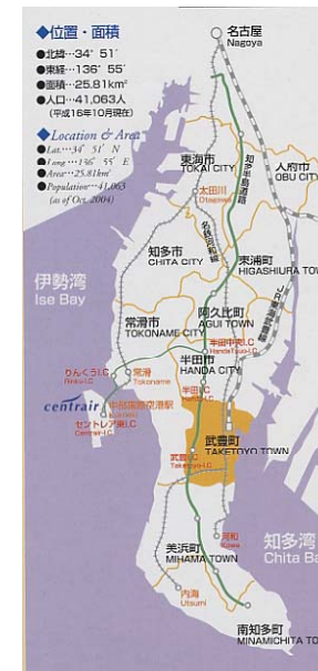
武豊町コミュニティバス利用促進友の会

小型ノンステップバス2台を町が購入し、平成22年7月から5年間の計画で、コミュニティバス試行運行がスタートした。