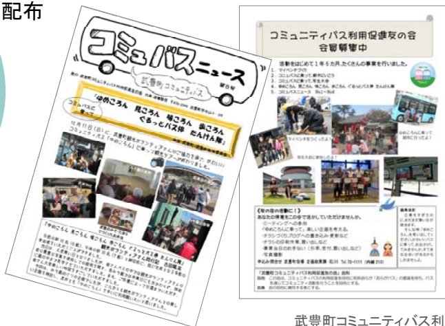
武豊町コミュニティバス利用促進友の会