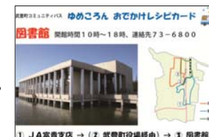
武豊町コミュニティバス利用促進友の会