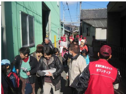
武豊町コミュニティバス利用促進友の会