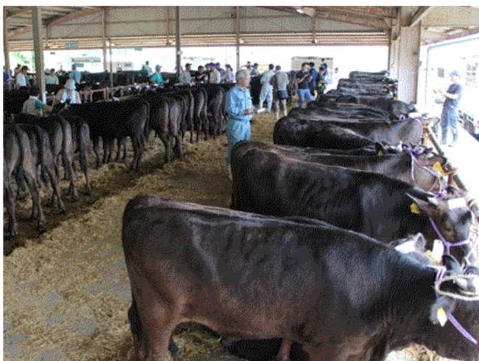
写真1 新城和牛子牛市場

愛知東農協の位置する新城設楽地区は県内トップの和牛子牛の産地である。地域内で和牛繁殖を行っている農家は令和2年1月現在で37戸あり、母牛頭数は866頭、1戸当たりの平均飼養頭数は23.4頭である。しかし子牛生産を行っている農家で母牛頭数20頭以上の農家は12戸と全体の3分の1しかいない（図1）。また、高齢化が進んでおり将来的には生産農家の減少にともなう産地縮小が懸念されている。愛知東農協の和牛部会はこの状況の中、若手経営主たちが主体となって産地を盛り上げている。