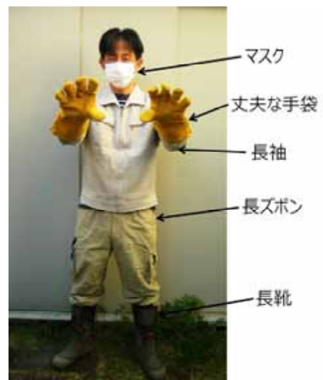
写真2 捕獲された鳥獣の 処分時の身支度

鳥獣捕獲許可は、捕獲された鳥獣の処分を含む一連の作業すべてを認めるものである。言い換えれば、捕獲された鳥獣の処分（殺処分及び死体の処分、錯誤捕獲への対応）を農業者が実施しなければならず、殺処分の覚悟が求められる。実際にアライグマやハクビシンが捕まると「かわいそうだ」と感じるのが人情であるが、間違っても隣町などへ運んで逃がしてはいけない。