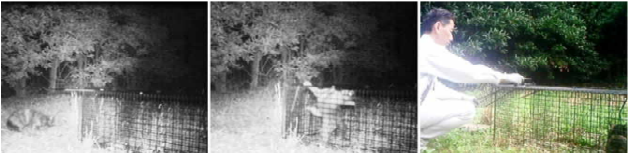
写真1 ネコの錯誤捕獲と対応 （左：エサに誘引されてネコが現れ、 中央：捕獲された、 右：翌朝の見回りで発見し、逃がす）

誤って捕獲してしまった目的外の鳥獣は、速やかに逃がさなければならない。目的の鳥獣であってもそのまま放置して死亡させることは動物愛護上避けるべきで、できるだけ苦痛が少ない方法で速やかに殺処分する。