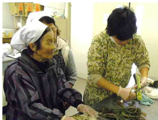
「干しずいき」の作り方を学ぶ若手会員（右）

令和元年12月に行われた研究会では、ベテランの会員が伝統的な保存食である「干しずいき」の作り方を実演しながら説明した。若手会員はずいきに適したサトイモ品種の葉柄の皮のむき方や裂き方、さらには乾燥の仕方について手ほどきを受け、技術を身につけた。