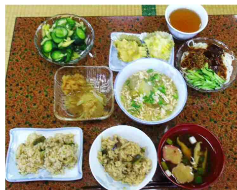
「酢味噌そうめん」や 「とうがん料理」など

材料の農産物は、季節の食材を会員たちが持ち寄り、低予算での研究会活動を可能にしてきた。夏には「酢味噌そうめん」や「とうがんのそばろあんかけ」など涼を