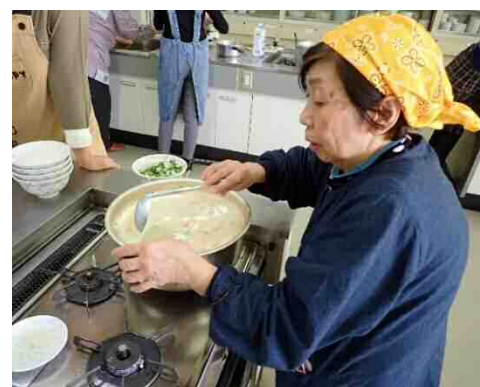
「鮭の粕汁」を作る会員