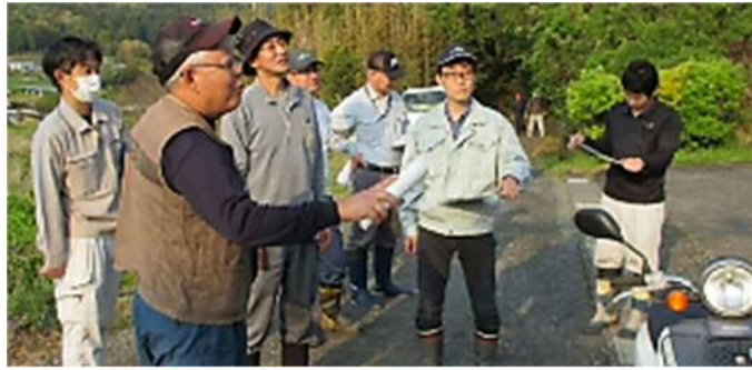
写真2 集落点検の様子