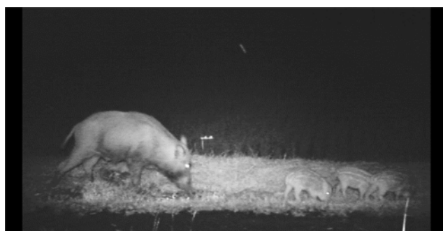
写真1 畦畔を掘り起こすイノシシ

獣害被害を減少させるためには、集落ぐるみで一体的に対策を講じることが重要であることから、本集落では、住民の獣害に対する意識の差を埋めることが必要であった。