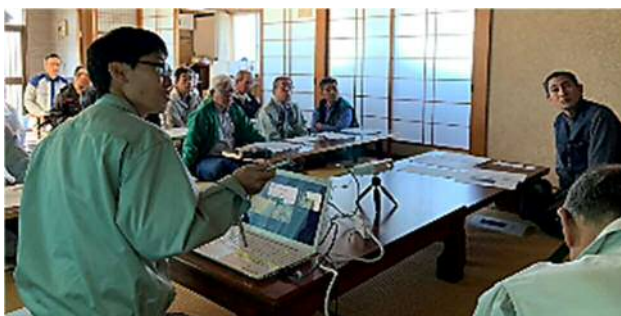
写真3 集落座談会の様子

柵の設置は計画どおりに実施された。事前に老木を伐採し、倒木による柵の損壊を防ぐなど、「設置後の維持管理」のことも考えた取組も見られ、住民の意識の高まりを感じた。