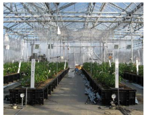
写真1 トマト栽培ハウス

促成栽培は平成19年8月10日に播種、12月26日に8段で摘心、収穫期間11月5日～平成20年2月28日とした。半促成栽培は、平成19年12月7日播種、平成20年5月2日摘心、収穫期間4月17日～7月4日、長期栽培は平成19年8月1日播種、平成20年5月12日に21段で摘心、収穫期間平成19年10月26日～平成20年7月7日とした。