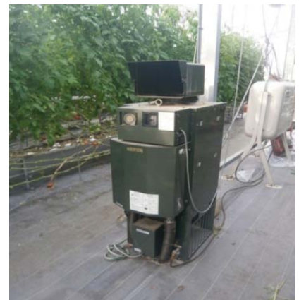
写真1 田原市で導入されている 炭酸ガス発生装置

愛知県のトマト産地では、温度や湿度、CO 2 濃度などの栽培環境を作物の生育に適した状態に調節し、生産性を高めることを目的とした環境制御技術が注目されている。田原市のトマト類農家も、炭酸ガス発生装置や細霧装置を導入し、環境測定データおよび作物の生育をもとに日々の環境を制御している。しかし、効率的な活用方法については、換気と効率的な炭酸ガス発生装置の稼働（温度と二酸化炭素濃度の関係）などの環境要因同士の調整など、未確立な部分も多い。そこで、研究機関やメーカーが開発した先進的な技術による栽培実証を調査したので報告する。