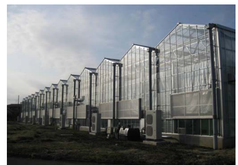
写真2 （独）農研機構の太陽光利用型 植物工場の外観

植物工場には、LEDなどの人工光源のみを使用した完全人工光型と太陽光の利用を基本とした太陽光利用型の2種類がある。ここでは太陽光利用型植物工場（栽培面積1,620m 2 ）についての、さまざまな新しい技術に関して、農研機構が中心となり、企業や大学が連携してグループ（コンソーシアム）を構成し実証研究を行っている。