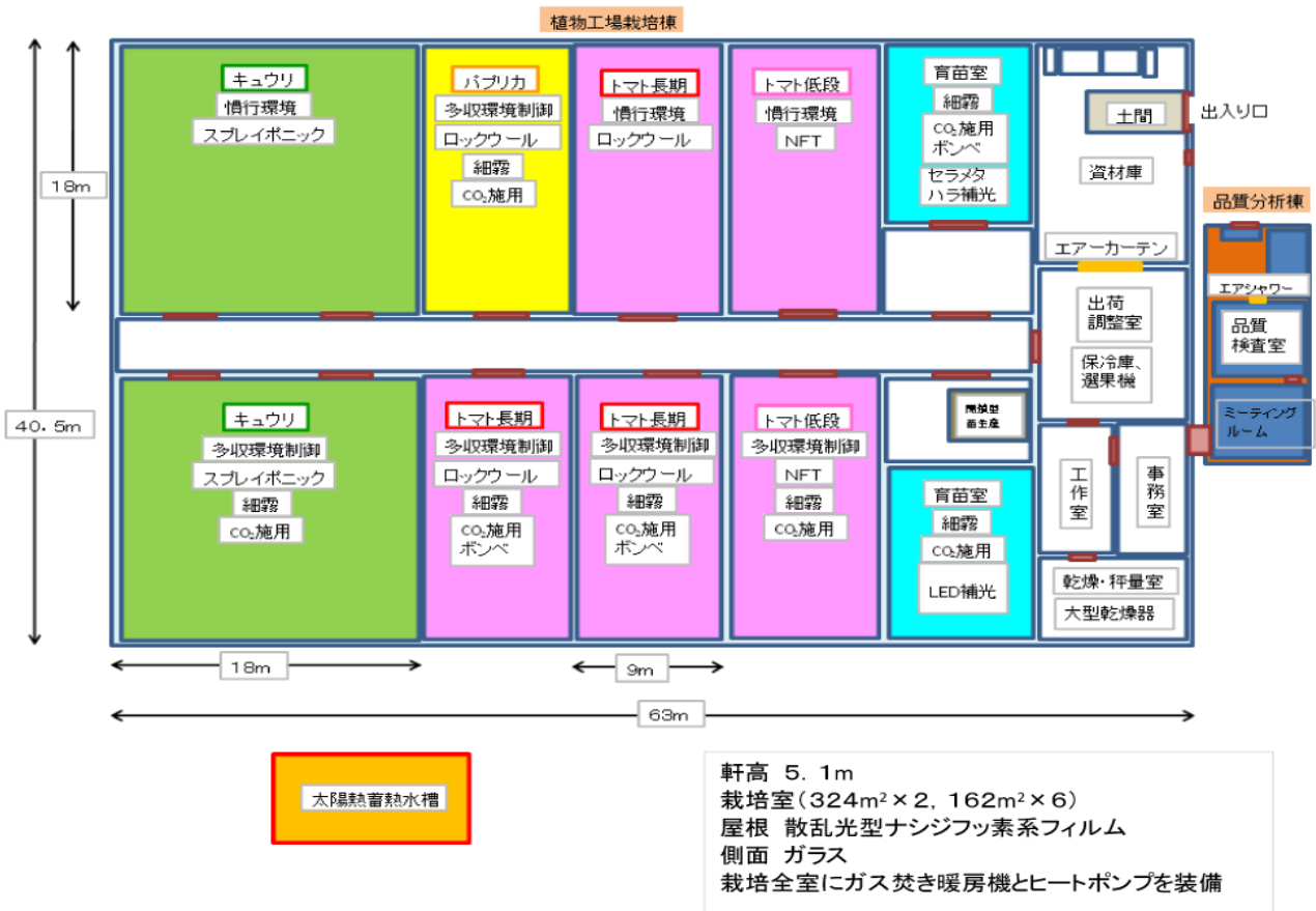
農研機構(NARO)植物工場つくば実証拠点の施設の概要

環境制御技術だけでなく、自動搬送システムによる収穫作業の効率化など、施設園芸の高度化・効率化に繋がる総合的な技術の実証を、トマト、キュウリ、パプリカの養液栽培で行っていた（図1）。