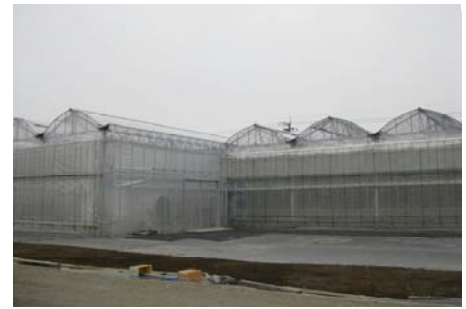
写真3 (株) 誠和 小金井工場の外観

同工場では、オランダ・プリバ社製の複合環境制御機器“マキシマイザー”を用いて施設内環境制御に取り組み、ロックウール耕を用いたトマト長期栽培で、年間収量40 t /10aを目標とした実証を行っている。