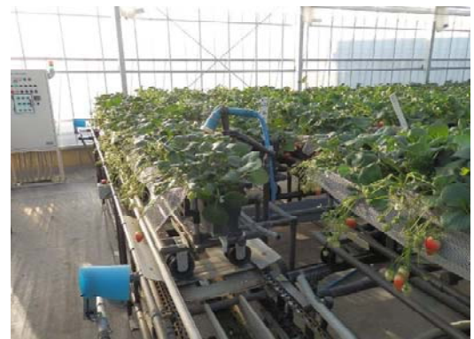
写真4 ベッドが移動することで通路を無くし 栽植密度を上げることが可能なイチゴ の移動栽培システム

イチゴ栽培では、愛知県における高設栽培で通常7,500株/10a植え付けるのに対し、10,000株/10aと密植が可能な移動栽培システム（写真4）、イチゴ収穫ロボットによる収穫の自動化、軽作業化の実証およびハエによる受粉試験を実施していた。