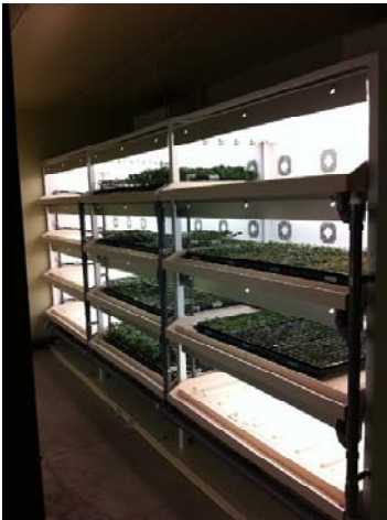
写真1 人工光型一次育苗施設

ハウスではトマトを5,000株/10aと密植し、養液栽培による給液の自動制御と自動環境制御装置であるユビキタス環境制御システム（UECS： www.uecs.jp を参照）を利用していた。UECSを利用して天窓、側窓、遮光カーテン、換気扇、細霧、循環扇などの自動制御を行い、トマトに最適な栽培環境を作り出していた（写真2）。また、炭酸ガス施用効果の実証も行っており、玉の肥大が良く増収効果が見られるとのことであった。他には、相対湿度を90%以下に下げる目的で除湿装置や換気装置（写真3）を導入したり、夏期高温時の夜冷のためにヒートポンプを試験導入したりと様々な試験を行っていた。