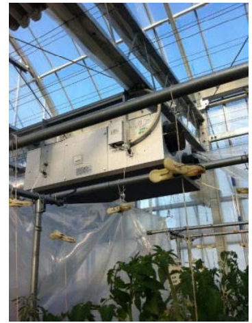
写真3 過湿を防ぎ、病害発生を 抑えるための熱交換式除湿 換気装置