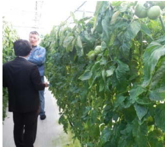
写真2 炭酸ガス施用実証ハウス内の トマト低段密植栽培の生育状況