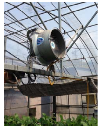
写真 ミストファン

イチゴ高設栽培の収穫後期におけるハウス内の高温は果実を軟化させ、日持ち性などの品質の低下につながる。また、生育不良となり減収の一因ともなる。そこで、この時期の高温対策としてミストファンを稼働させることでハウス内環境の改善を図り、収量や品質に及ぼす影響を明らかにする。