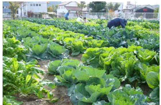
写真1 整然と作付けされた体験農園

東京都練馬区で誕生した「農業体験農園」が、都市住民との交流により付加価値を生み出す新しいビジネスモデルとして注目されている。愛知県では、平成24年度に開設したモデル農園3か所を含め、現在9か所が開園されている。今回は、農業体験農園の仕組みとモデル農園の運営状況について紹介する。