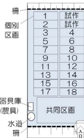
図3 農園の整備状況

園主は、月に1回程度講習会を開催し、定植から栽培管理、収穫の方法などを指導した。また、講習会のほかには、農園の見回りや入園者の管理のフォロー、農薬散布、耕うんや種苗の準備などを行った。