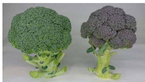
左：通常のブロッコリー

そこで、アントシアンの発生抑制と収穫斉一性の向上を目的に、生育後期のかん水と追肥を行う実証試験に取り組んだ。