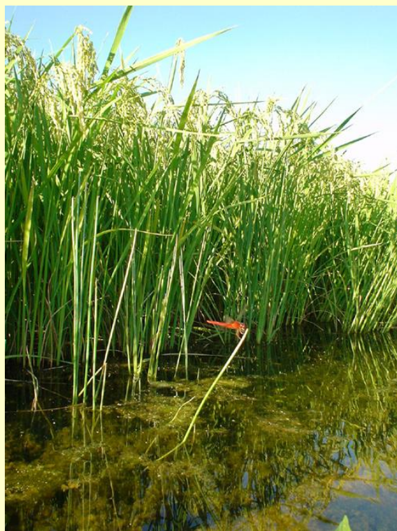
深水無落水栽培の状況(成熟期) 水深は20cm。品種はコシヒカリ。

愛知県が開発した省力的な栽培法である「不耕起V溝直播栽培」と湛水深を深くする「深水管理(水深15~20cm)」を組み合わせた「深水無落水栽培」が、白未熟粒などの発生を防ぎ玄米外観品質の低下を軽減させることを明らかにしました。深水管理する期間は、入水直後から成熟期が望ましいですが、分けつ盛期から出穂期でも外観品質の向上は期待できます。なお、水管理以外の管理法は、通常の不耕起V溝直播栽培と同じです。