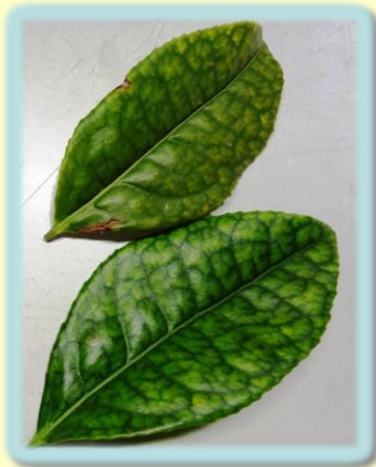
茶葉の亜鉛欠乏症状

食品添加物であるグルコン酸亜鉛は、茶の亜鉛欠乏対策として、安全で有効な葉面散布剤であることを明らかにしました。