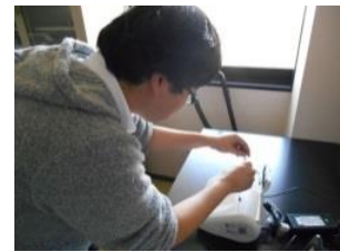
LAMP用反応機器を用い、65℃で30分間、LAMP反応