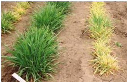
コムギ縞萎縮病の発生状況 (左：健全株、右：罹病株)

遺伝子診断技術の一つであるLAMP法を用い、ムギの土壤伝染性ウイルスのコムギ縞萎縮ウイルス、ムギ類萎縮ウイルス、コムギモザイクウイルス、及びオオムギ縞萎縮ウイルスを短時間で正確に検出する技術を開発しました。また、これらの内、コムギに感染する3種類のウイルスについては、一度に識別できるマルチプレックスLAMP法も開発しました。