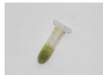
コムギの葉を磨碎し、磨碎液をLAMP反応液に添加