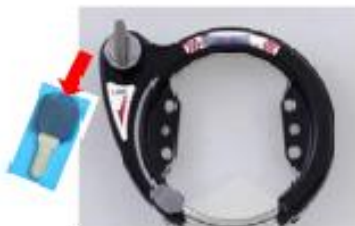
シリンダー式脚錠