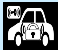
追加のイモビライザー