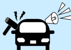
周囲に異常を知らせる警報装置