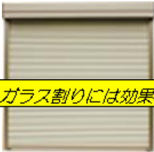
ガラス割りには効果