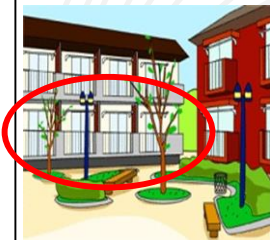
アパート・マンションにおける「1階」の被害率