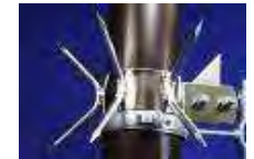
排水パイプのよじ登り対策

2階へ通じる配管や樋も、ドロボウにとっては、恰好の足場となってしまいます。配管、樋の位置を考えたり、有刺鉄線を巻き付けるなどの対策をとりましょう。