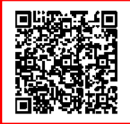
令和7年中の自転車の法令違反（自転車が第一当事者となる人身交通事故）