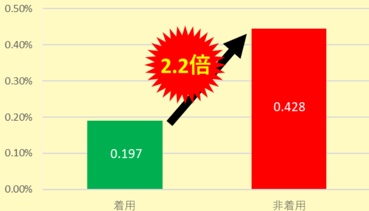
ヘルメット着用時と非着用時の致死率の比較

愛知県内自転車死者の 負傷主部位構成率 (平成30年～令和4年 死者総数128人)