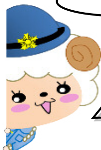
採用センター公式マスコットキャラクター ヨウ子ちゃん