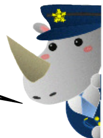
採用センター公式マスコットキャラクター サイ蔵くん