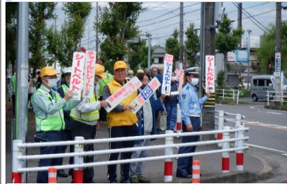
5/15シートベルト関所を行いました。

シートベルト・チャイルドシートをしていなかったために助かる命も助からなかった事故が発生しています。