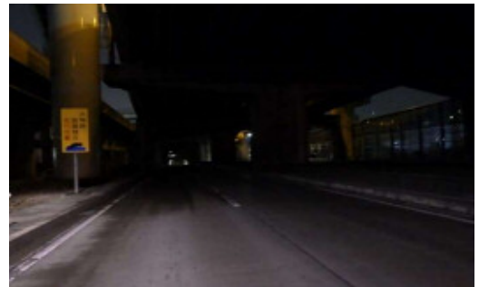
夜間は視界が悪くアンダーパスの中の状態が分からないので要注意