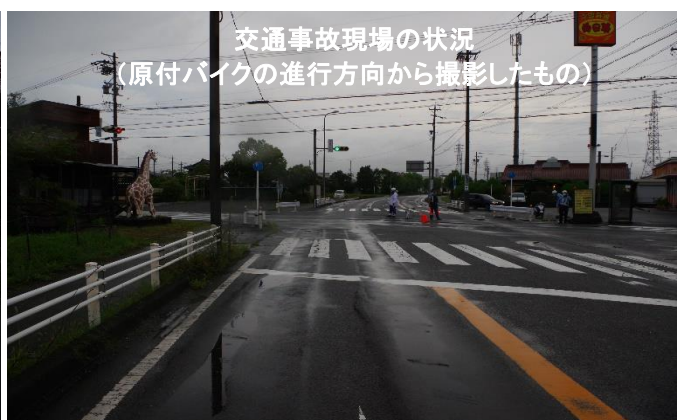
交通事故現場の状況 (原付バイクの進行方向から撮影したもの)