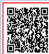
警察庁 自転車ポータルサイト 二次元コード