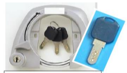
ディンプルキー カギにくぼみがあるタイプのもの。