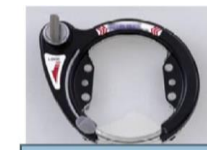
シリンダー錠 カギを差し込んで回すタイプのもの。