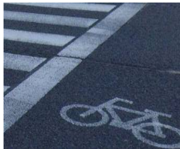
自転車横断帯標示