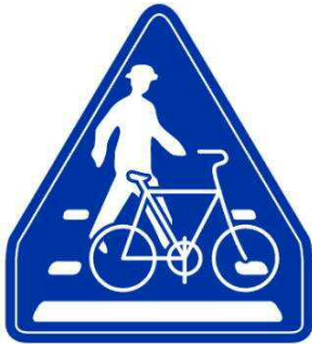
横断歩道・自転車横断帯標識

自転車は、自転車横断帯のある場所付近では、自転車横断帯によって道路を横断しなければいけません!