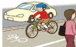
普通自転車歩道通行可標示