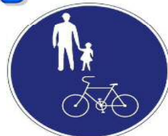
自転車及び歩行者専用標識