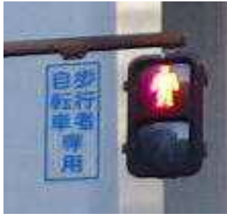
歩行者・自転車専用信号機

自転車は、「歩行者・自転車専用信号機」があるときは、その信号に従わなければいけません!