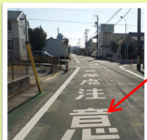
同黄色側イメージ