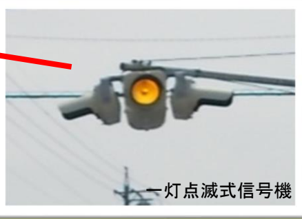
一灯点滅式信号機