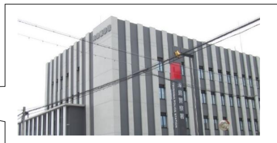
新庁舎完成 元の場所に戻ります