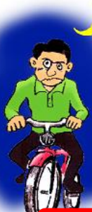
無灯火・飲酒運転