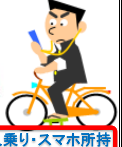
二人乗り・スマホ所持