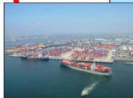
「名古屋港」 総取扱貨物量日本一の総合港湾