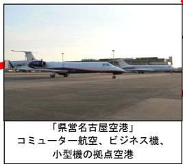
「県営名古屋空港」 コンピューター航空、ビジネス機、 小型機の拠点空港