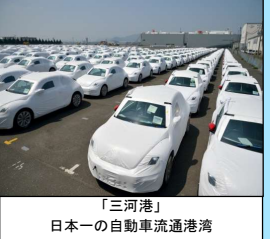
「三河港」 日本一の自動車流通港湾

愛知県産業立地サポートステーション 052-954-6372 (愛知県経済産業局産業部産業立地通商課) 03-5212-9972 (愛知県東京事務所産業誘致課)