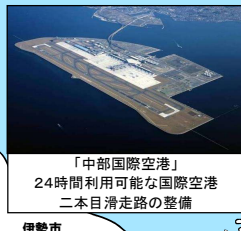
「中部国際空港」 24時間利用可能な国際空港 二本目滑走路の整備