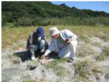
(アカウミガメの保護活動)