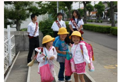
犬山市立犬山西小学校

あいさつ できていますか？ 中学生と小学生がいっしょに あいさつ運動をしています。