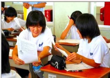
蒲郡市立大塚中学校