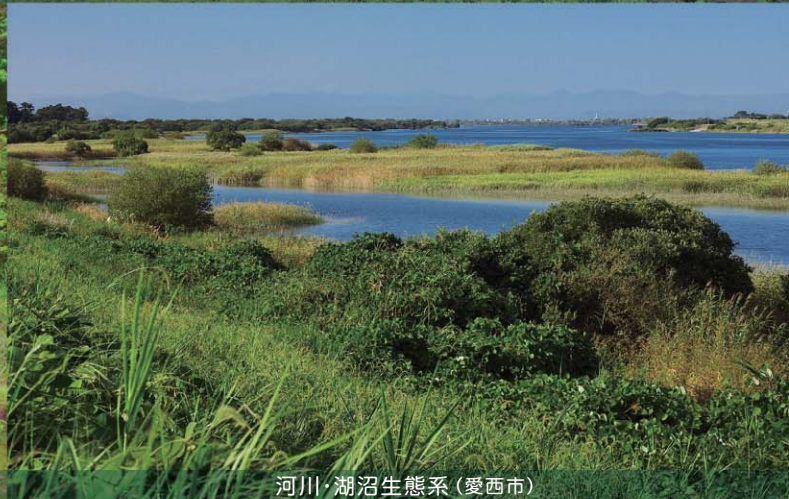
河川・湖沼生態系(愛西市)