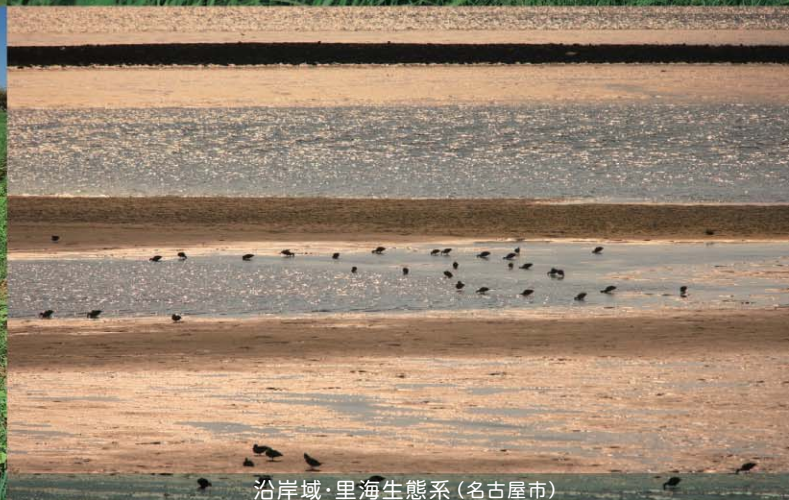
沿岸域・里海生態系(名古屋市)