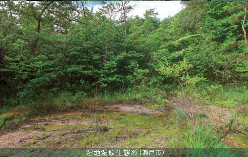
湿地湿原生態系(瀬戸市)