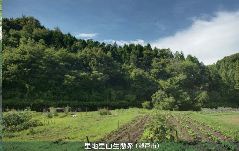
里地里山生態系(瀬戸市)