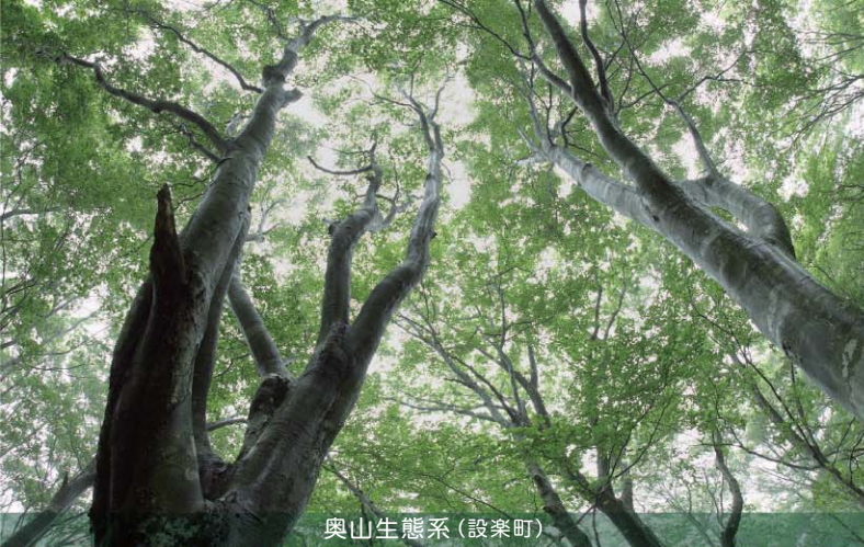
奥山生態系(設楽町)