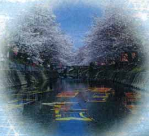
五条川の「のんぼり洗い」(岩倉市)