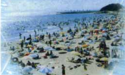
人出で賑わう内海海水浴場(南知多町)