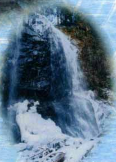
雪化粧された不動川の不動滝(東栄町)