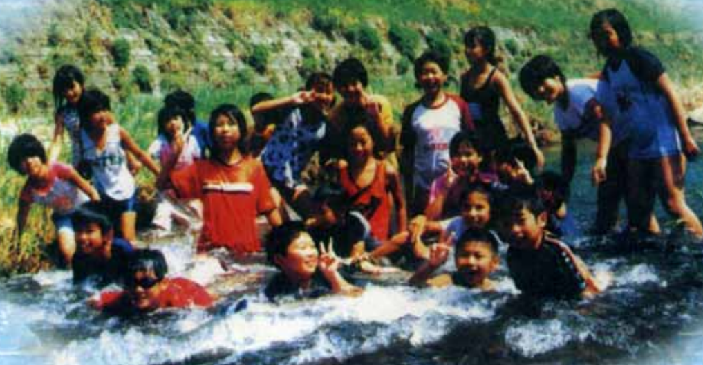
大入川で魚つかみを楽しむ小学生(津具村)