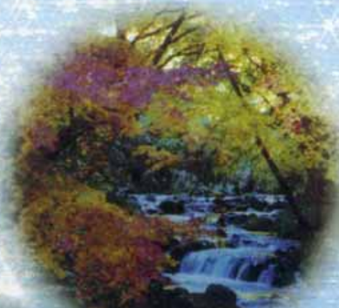
紅葉に色づく野原川(下山村)