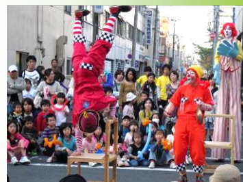
楽しいパフォーマンス

毎年 11 月に開催。広小路通りを歩行者天国にして、大道芸人のパフォーマンスが繰り広げられる。バルーンアート、フェイスペイント、レクリエーションスポーツも同時開催。