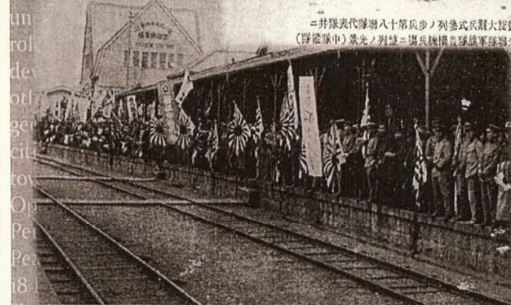
兵ノ人送見態ールカ於ニ驛橋豊 (隊道濱北八一歩)