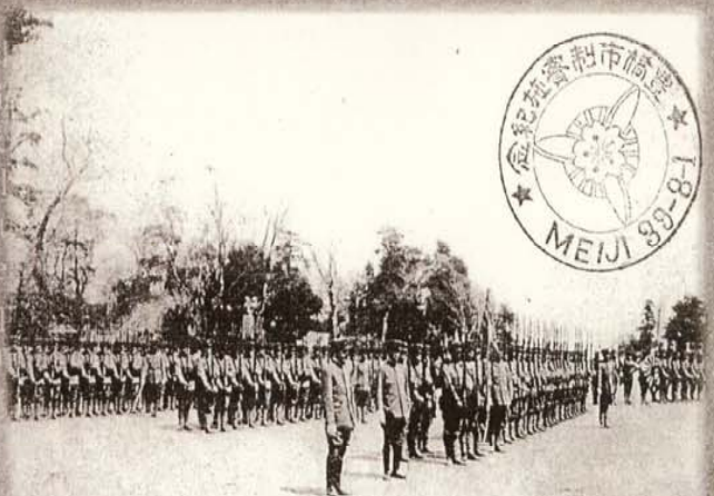
二井隊表代隊第八十歩兵少列参式兵隊大砲軍団 (野砲隊中) 景光ノ列進ニ男兵練儀豊隊隊軍隊全備後