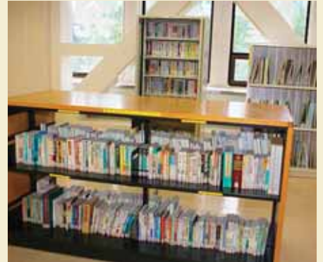
▲人権ライブラリー