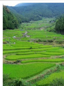
四谷の千枚田(新城市)