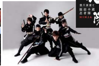
忍者観光 徳川家康と服部半蔵忍者隊