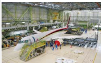
国産ジェット旅客機「MRJ」