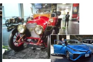
トヨタ博物館と 燃料電池自動車(FCV)MIRAI