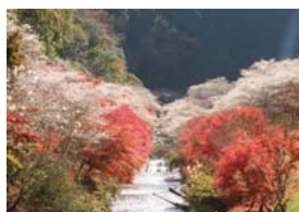
小原四季桜まつり(豊田市)