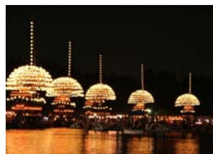
尾張津島天王祭の車楽舟行事