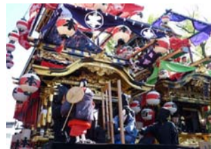
知立の山車文楽とからくり