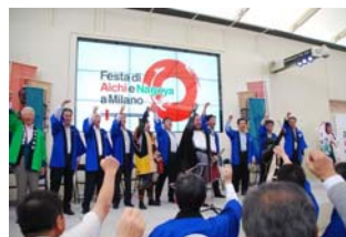
オープニングセレモニー(ミラノ)