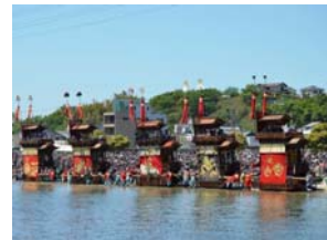
亀崎潮干祭の山車行事