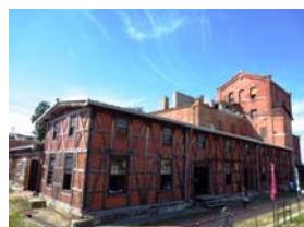
半田赤レンガ建物