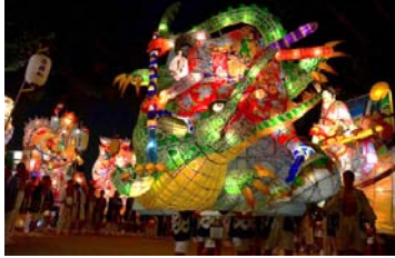
刈谷万燈祭(刈谷市)