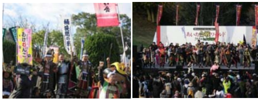
「あいち合戦ワールド2014in大高緑地」の様子