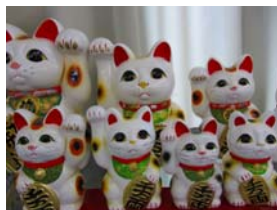
常滑市陶磁器会館の「招き猫」