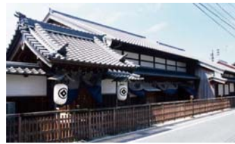
旧東海道(二川宿本陣資料館)