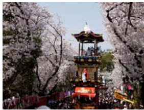
犬山祭の車山行事