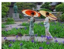
かきつばた(知立市)