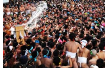
はだかまつり(稲沢市)