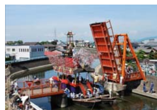
須成祭の車楽船行事と神葎流し