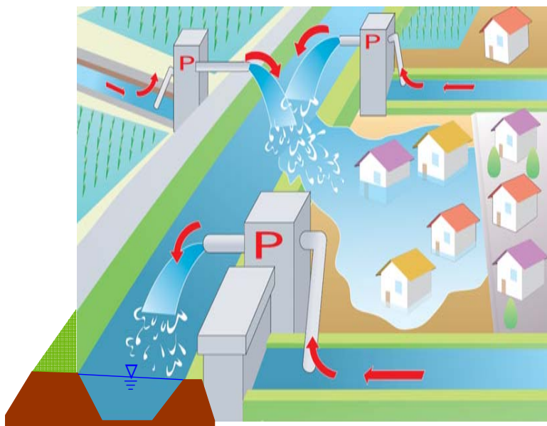
破堤時被害状況イメージ図 (このような事態を避けるために排水調整を行う)