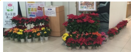
5回の屋内展示を実施