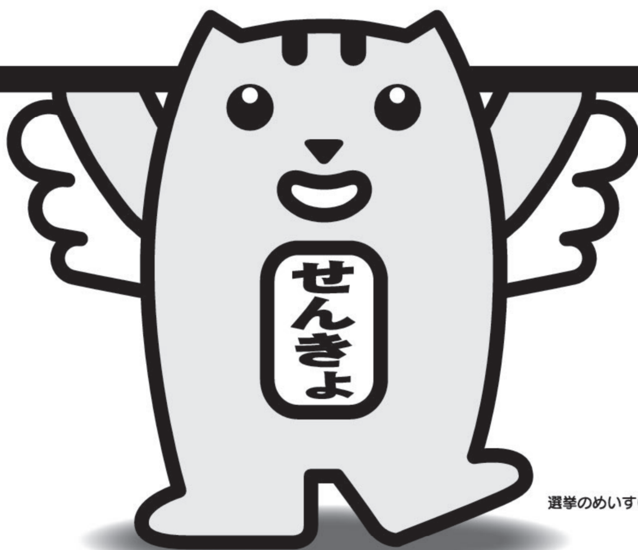
選挙のめいすいくん