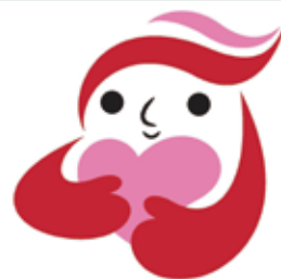
犯罪被害者等支援 シンボルマーク 「ギュっとちゃん」

侵害の回復を図るには、一人一人が犯罪被害者等の声に耳を傾け、考えることが大切です。